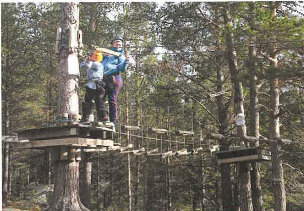
Fra klatreparken i Vågå.