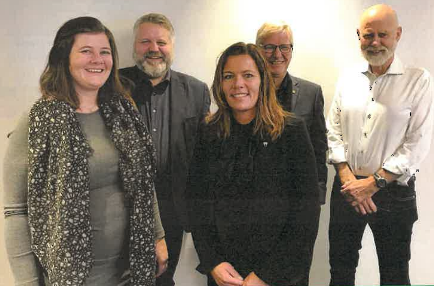
Fra NTNU i Nord-Gudbrandsdal til Universitetsregion Nord-Gudbrandsdal

Dette er også interessante problemstillinger for NTNU og i tråd med deres samfunnsoppdrag. Med dette som bakgrunn besluttet Regionrådet å videreføre satsingen i 2018, med mål om å hente mer kunnskap og forankre satsingen både politisk, administrativt og i arbeidslivet. Regionen ønsker å ta en aktiv rolle i å formulere og svare på egne kunnskaps- og kompetansebehov. I arbeidet med utfordringene vektlegger Regionrådet at fokus på bærekraft og smart-teknologi skal være bærende i satsingen.