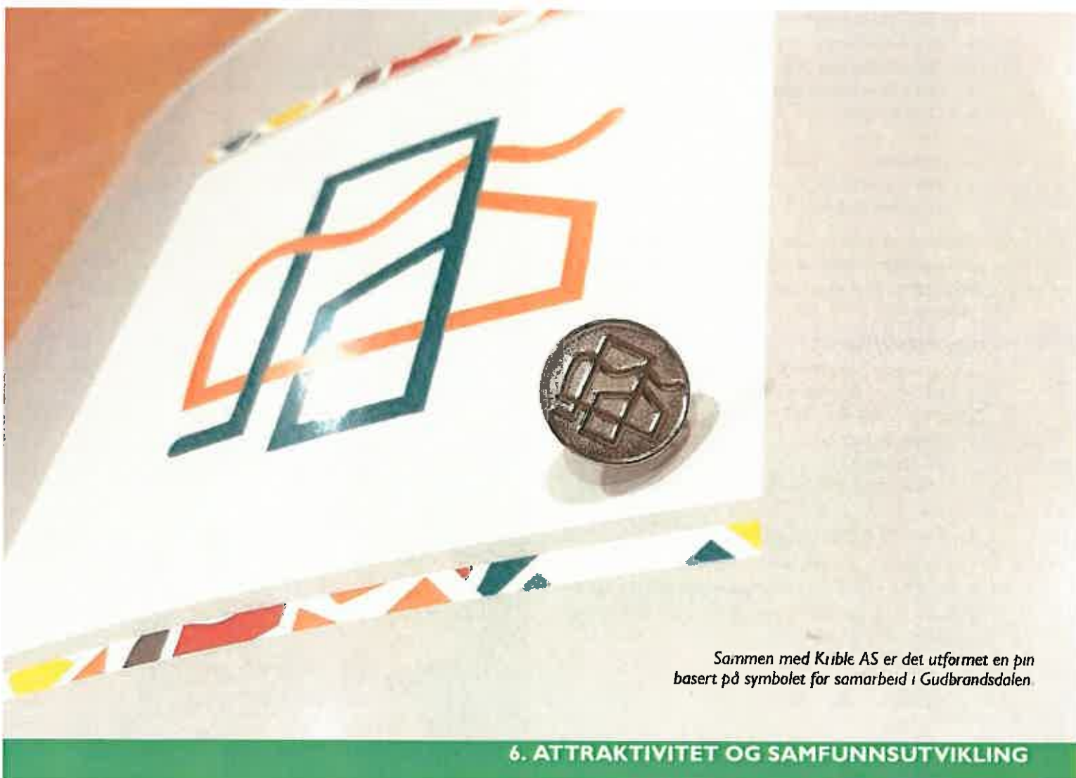
Sammen med Krible AS er det utformet en pin basert på symbolet for samarbeid i Gudbrandsdalen.