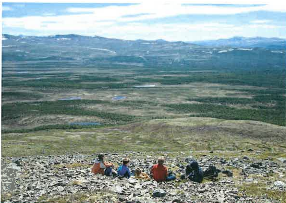
Flott utsikt fra Grønseterhøe på Dovrefjell.

Stolpejakten tar sikte på å aktivisere både unge og gamle; inaktive, skoleelever, syklistere, funksjonshemmede og rullestolbrukere – eller dem som rett