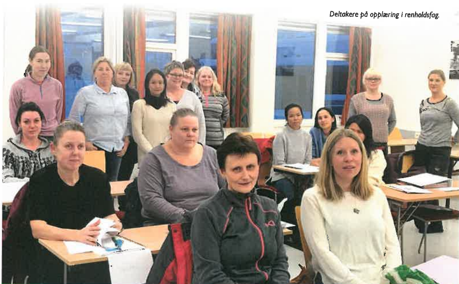
Deltakere på opplæring i renholdsfag.