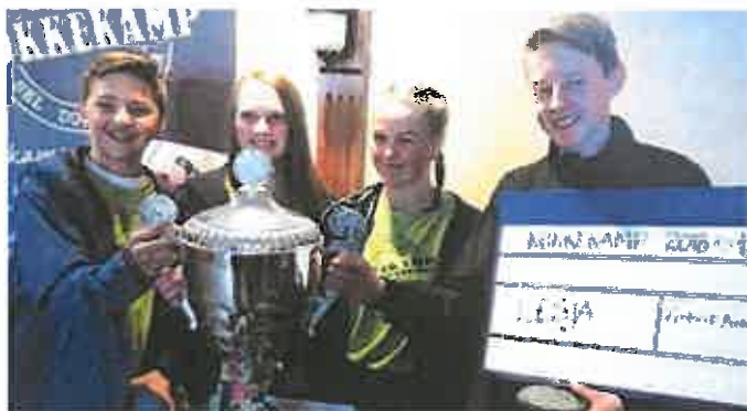
Vinner av årets kokkekamp 2018: Lesja skule