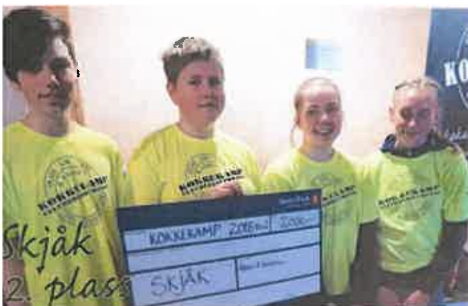
Skjåk ungdomsskule kom på 2. plass, mens Lom og Vågå delte 3. plassen