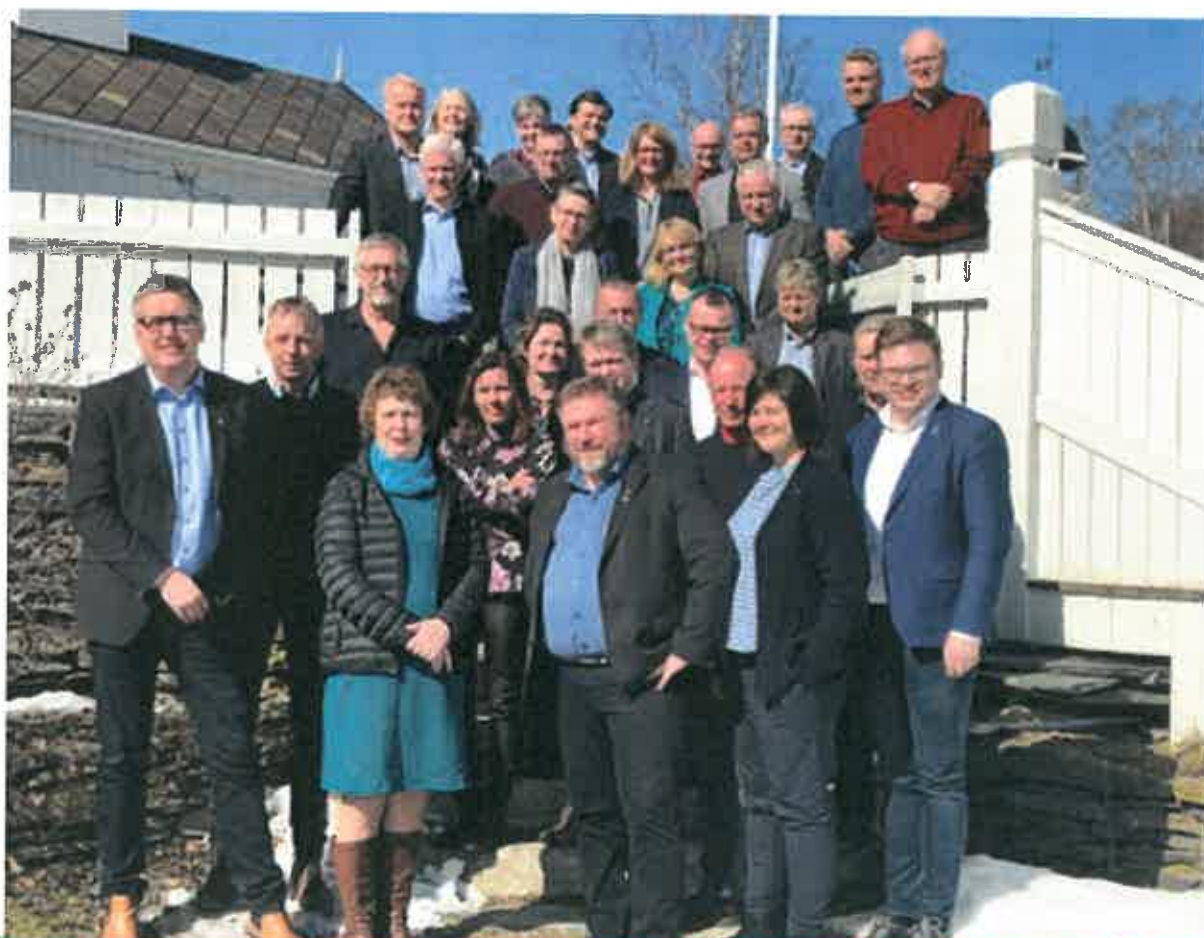
Ordførere og rådmenn samlet til Gudbrandsdalstinget.

Gudbrandsdalspraksis skal utvikles videre under fire hovedoverskrifter/tema: Medvirkning/demokrati, tjenestetilbud, planlegging og åpne dører. Av vedtakene framgår ellers at partene i videre arbeid med samfunnsutvikling/ Gudbrandsdalspraksis vil