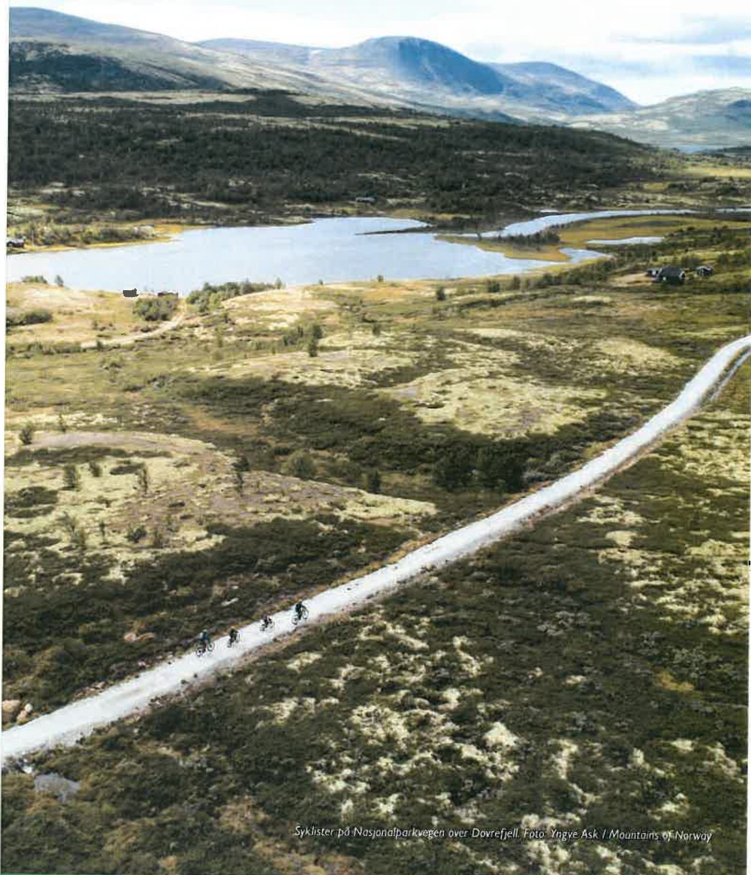
Syklister på Nasjonalparkvegen over Dovrefjell.