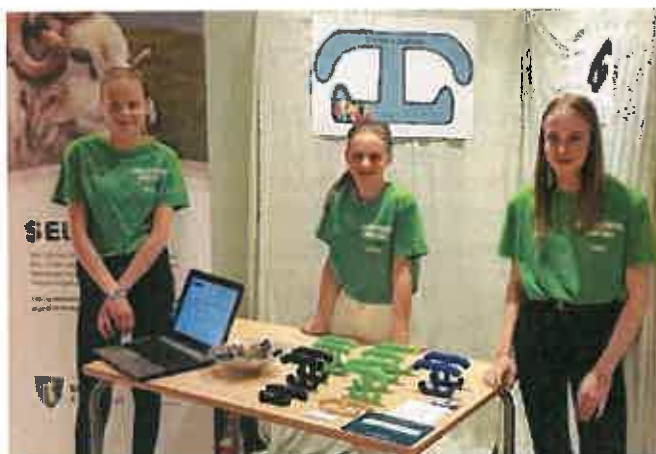
Over: Enkelt og praktisk EB - Heidal skule. Til høyre: Nudelsaks EB - Otta ungdomsskole - 2. plass i Beste salgsteam.

Green Box EB - Otta ungdomsskole - 3. plass i Beste Grønne Entreprenør